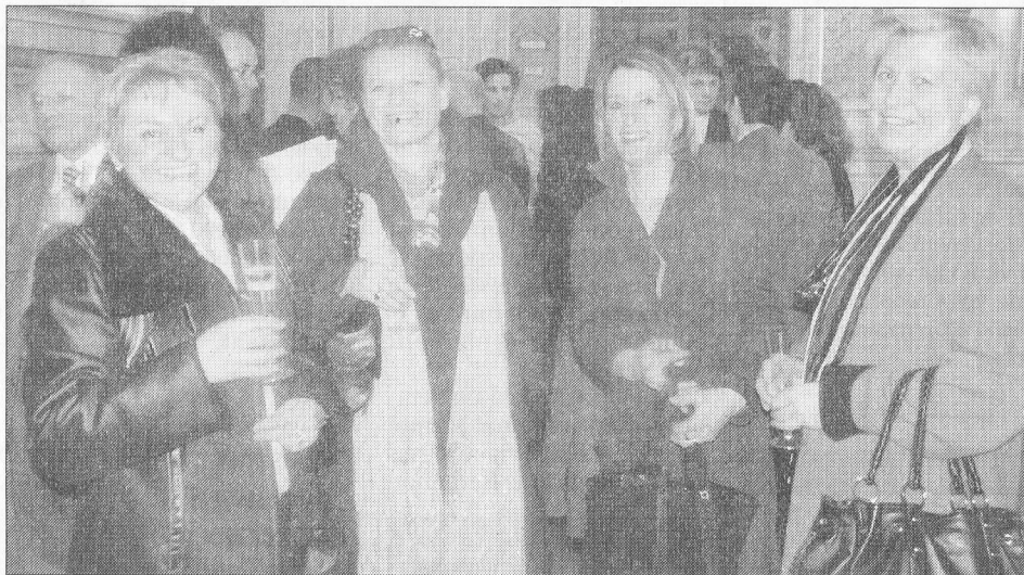
Les commerçants de la rive gauche étaient attentifs à l'analyse présentée, mardi, par la CCI sur l'évolution du comportement d'achat des habitants des quartiers sur lesquels ils sont implantés

L'enquête révèle que les achats non alimentaires se font en grande majorité à la Part-Dieu, en Presqu'Île ou encore à Saint-Priest et Vénissieux. Les comportements d'achat des habitants du 7 e sont donc globalement favorables aux grandes surfaces. Quant à Internet, il se crée une part de marché de plus en plus importante dans les domaines de la photographie, l'informatique ou la hi-fi.