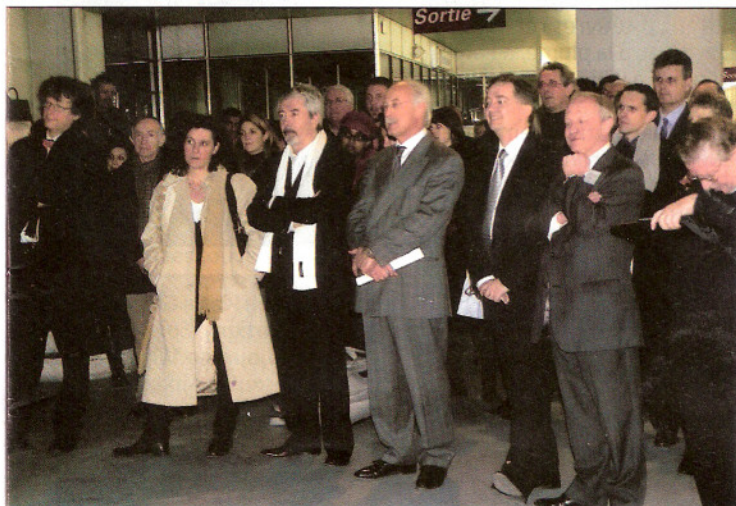
Les personnalités ont salué le dynamisme des commerces du 7 e

Lundi 29 janvier, s'est déroulée la cérémonie de vœux de l'Association de développement du commerce du 7 e arrondissement de Lyon, dans les locaux de Citroën, rue de Marseille. A cette cérémonie participaient près de 200 personnes : commerçants, artisans, habitants et partenaires de l'association. Cette dernière a pris le relais de la Fédération des associations de commerçants du 7 e arrondissement.